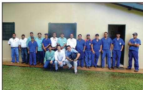
Colaboradores participantes do treinamento

Em compromisso com a preservação do meio ambiente, a Usina Açucareira Guaira, através do Departamento de Meio Ambiente, promoveu aos seus colaboradores no mês de Maio, um treinamento sobre Gerenciamento de Resíduos Contaminados. O treinamento envolveu os encarregados e líderes de todos os setores das oficinas, tendo como premissa, a capacitação e conscientização dos colaboradores quanto ao gerenciamento adequado dos resíduos contaminados (Classe I – Perigosos, de acordo com NBR 10004), gerados durante as atividades realizadas. Foi demonstrado aos