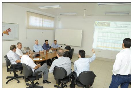
Reunião realizada no Escritório Agrícola