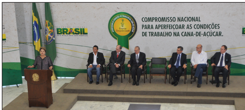
Presidenta da Republica Dilma Rousseff durante a cerimônia de entrega do Selo do Compromisso Nacional

A cerimônia de entrega do Selo do Compromisso Nacional aconteceu no último dia 14 de junho no Palácio do Planalto em Brasília, com a presença da Presidenta da República Dilma Rousseff , o Presidente do Senado José Sarney , o Ministro-chefe da Secretaria Geral da Presidência da República Gilberto Carvalho , entre outras autoridades. A outorga deste Selo foi um momento ímpar para o setor sucroenergético e para a Usina Açucareira Guaíra , uma das empresas homenageadas no evento. A Presidenta Dilma Rousseff destacou em seu discurso a importância deste momento para o Brasil e para o setor, comprovando que é possível produzir respeitando o meio ambiente e a legislação social. Além disso, destacou também, em conjunto com os outros representantes que discursaram a supremacia do etanol em relação aos outros combustíveis. De acordo com a Presidenta, durante muito tempo o etanol foi acusado de utilizar a Amazônia e ter práticas incompatíveis como o trabalho escravo, mas hoje, ainda de acordo com Dilma,