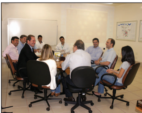
Reunião realizada com a diretoria da Syngenta.

No dia 30 de novembro, o CEO do seguimento cana de açúcar da Syngenta esteve presente na Usina Açucareira Guaíra Ltda, que foi a primeira a assinar o contrato mundial da nova tecnologia do PLENE, para uma reunião com todo o corpo técnico da Usina envolvido nesse projeto, a ser implantado a partir de fevereiro de 2012. Além do plantio do PLENE, foram tratados assuntos relativos às novas biotecnologias da Syngenta, que estarão disponíveis nos próximos anos