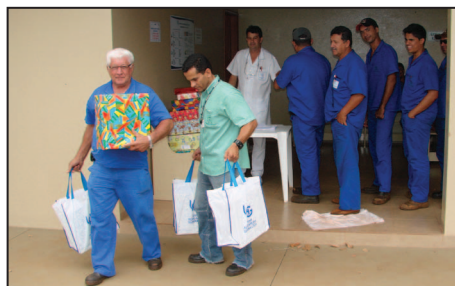
Distribuição de cestas e brinquedos.

Ao findar mais um ano e na proximidade do Natal, num ato que tem se repetido anualmente, a Usina Açucareira Guaíra Ltda, Fazenda Rosário e Central Energética Guaíra realizaram a distribuição de cestas de Natal a todos os colaboradores e brinquedos para todos os filhos até 10 anos. A ideia de promover o bem estar