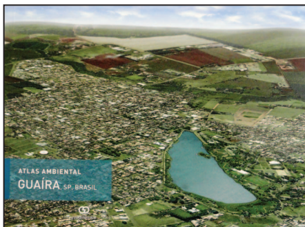
Capa do Livro Atlas Ambiental Guaíra

A BASF e a Usina Açucareira Guaíra lançaram no dia 25 de novembro, o Atlas Ambiental de Guaíra. A BASF escolheu a Usina Açucareira Guaíra para participar do projeto devido aos seus inúmeros prêmios recebidos e pelos trabalhos desenvolvidos em favor do meio ambiente e da sustentabilidade. Mais de 2.600 estudantes do ensino fundamental de todas as escolas públicas (municipais e estaduais) do município serão beneficiadas. O Projeto Educacional é gerido estrategicamente