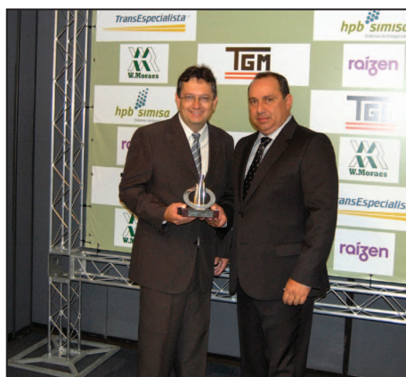
Representantes da empresa recebendo o Prêmio Mastercana “Saúde e Segurança do Trabalho”