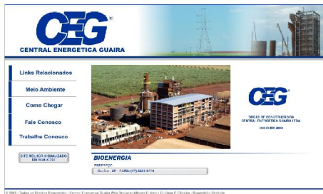
Layout do site da Central Energética Guairá