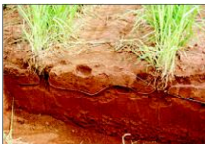
SOCA SEM CULTIVO

O cultivo mecânico das soqueiras, com os implementos tradicionalmente utilizados (tríplice operação), sempre foi uma prática controversa quanto aos seus resultados. Apesar disso, é ainda uma prática muito adotada principalmente para eliminar a compactação do solo (Foto 1 e 2), resultante da colheita mecanizada realizada em solos com alta umidade (ex: colheita realizada no início e final de safra com excesso de tráfego). O cultivo permite a incorporação dos fertilizantes ao solo, porém pouco se sabe sobre os seus efeitos no enraizamento da soqueira. Na Usina Açucareira Guaira, onde 100% da cana é colhida crua, isto é, sem queimar, os resultados de pesquisa (Tabela 1) indicam que a produtividade das áreas NÃO cultivadas é mais alta. A maior produtividade foi obtida quando a cana NÃO foi cultivada e o adubo colocado superficialmente sobre a linha de cana (Foto 3). Tabela 1. Efeito do cultivo da soqueira e forma de adubação na produtividade do 2º e 3º corte, Usina Açucareira Guaira - 2009. O aumento de produtividade em relação ao tratamento convencional (adubação incorporada + cultivo) foi de 40 t/ha se considerarmos a