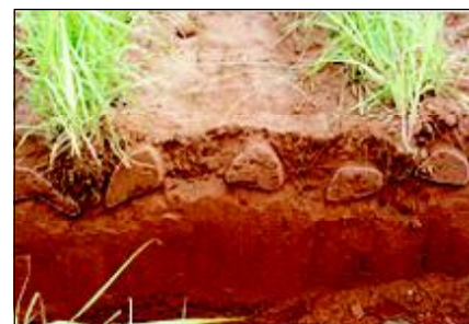
SOCA COM CULTIVO