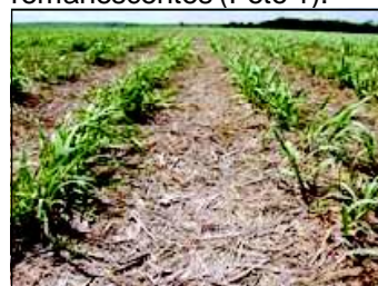
Foto 3 - Área sem cultivo, somente adubada superficialmente