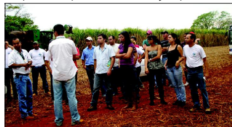
Alunos acompanhados pelos engenheiros e técnicos da empresa durante visita ao campo

vivenciados durante a visita será de suma importância para a sua formação profissional.