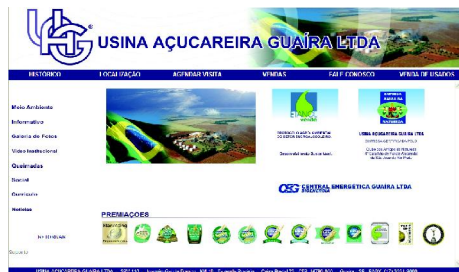
Layout do novo site da Usina Açucareira Guairá