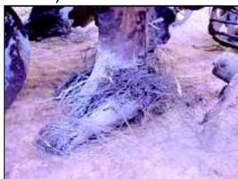
Foto 1 - O cultivo da soqueira arranca muita raiz de cana ainda viva

incorporada a diferença foi de 22,4%. O cultivo da soqueira além de ser uma operação cara, acelera o processo de decomposição da palha (Foto 2), aumenta as perdas de água do solo por evaporação e a destruição de raízes remanescentes (Foto 1).