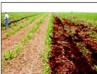
Foto 2 - Evaporação da água do solo e a degradação da palha são maiores nas áreas cultivadas