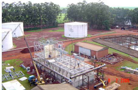
Torre de Refrigeração

Torre de Refrigeração - É um equipamento, que visa substituir o spray aberto do setor de resfriamento de dornas e mosto. As torres tem performance mais eficiente que o spray, mantendo constante a temperatura da água resfriada. Outra vantagem deste sistema é a economia de água, comparando com o sistema de spray aberto, no volume de água que recirculamos, chega a quase 100 m³/hora a redução da água de reposição. Na foto abaixo, podemos observar o estágio em que se encontra a montagem das 3 torres de refrigeração.