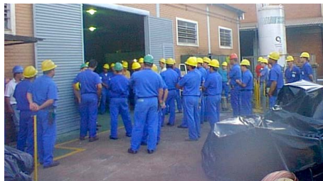
D.D.S. Sendo realizado nos setores da Elétrica/Instrumentação

a união e o esforço de todos, os objetivos são atingidos. A realização do DDS , é sem dúvida, uma das formas mais práticas e eficazes que existe para prevenir acidentes de trabalho e, faz com que os colaboradores vão se conscientizando da necessidade de adotar medidas prevencionistas, antes e durante a realização de cada serviço.