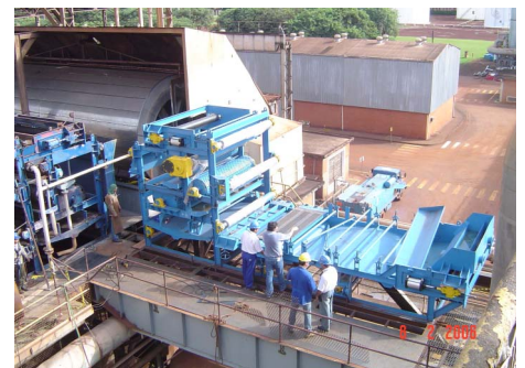
Prensa Desaguadora Vertical

Prensa Desaguadora Vertical: A instalação de mais uma prensa de lodo, visa diminuir a perda de sacarose na torta, possibilitando a refiltração da torta do filtro rotativo nas 2 prensas verticais, desafogando um setor que trabalhava sobrecarregado.