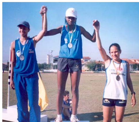
Atleta guairense patrocinada pela Usina A. Guaíra, que foi 1.ª colocada em prova

A equipe de atletismo conquistou 03 medalhas, sendo 02 de ouro e 01 de Prata. Guaíra ficou em 6.º lugar no quadro de medalhas e 8.º lugar na pontuação geral. Parabenizamos todos os atletas e técnicos que participaram dos jogos, pelos objetivos alcançados, desejando a todos um futuro promissor com novas conquistas.