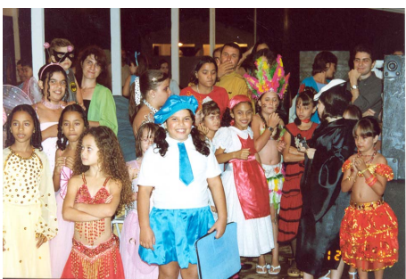
As meninas encantaram a todos com suas belas fantasias