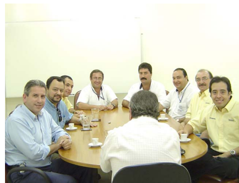
Reunião realizada durante a visita dos diretores da Valtra e Borgato.

Para alcançarmos nossos objetivos, temos trabalhado em conjunto com algumas universidades em pesquisas e novas técnicas. Os resultados obtidos, são fruto de um trabalho em equipe, e parabenizamos a todos que colaboraram direta ou indiretamente para merecermos tal reconhecimento.