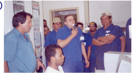
Colaboradores sendo submetidos ao exame de espirometria

conseqüentemente, uma melhoria da qualidade de vida do trabalhador. Foram realizados exames de sangue, urina, espirometria, raio-x tórax e audiometrias. Foram realizados 3.776 exames entre colaboradores da Usina Açucareira Guaira Ltda e Fazenda Rosário.