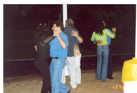
Os pais também se divertiram e dançaram muito animando a nossa festa