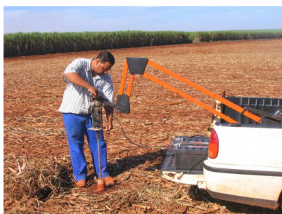
Colaborador colhendo amostra de solo com trado elétrico

Atualmente, o processo de amostragem do solo é bem diferente. A malha de pontos de amostragem é gerada antecipadamente no escritório, garantindo uma melhor localização dos pontos. De 1 amostra para cada 20 hectares reduzimos para 1 a cada 4, utilizando um trado elétrico.