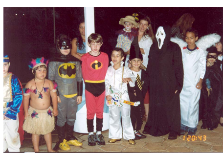
Houve uma participação efetiva dos meninos que surpreendeu a todos