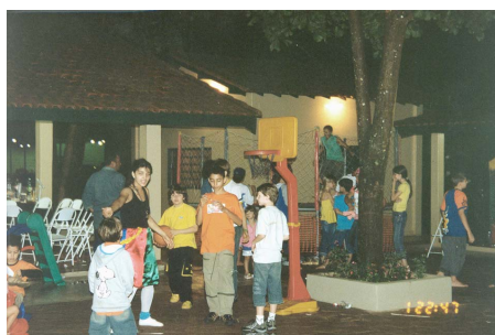
A equipe de animação não deixou as crianças paradas um minuto