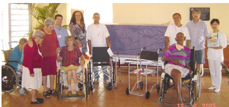
Diretores e internos do Centro de Ação Social recebem equipamentos doados

A Usina Açucareira Guaira e Fazenda Rosário, sempre que possível, colaboram com as entidades do município de Guaira. Com este intuito e atendendo a uma solicitação da diretoria do Centro de Ação Social Nossa Senhora D’Aparecida, foram doados 01 cama hospitalar com grade e colchão, 01 cadeira de rodas, 01 cadeira