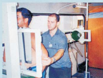
▲ Raio - X de tórax