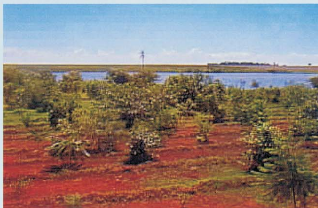
▲ Área em que foi realizado o plantio

No trabalho de preservação e recomposição das áreas de preservação permanente, foram plantadas mais de 45 mil mudas de árvores. A preservação da natureza é compromisso da empresa, e este trabalho será contínuo.