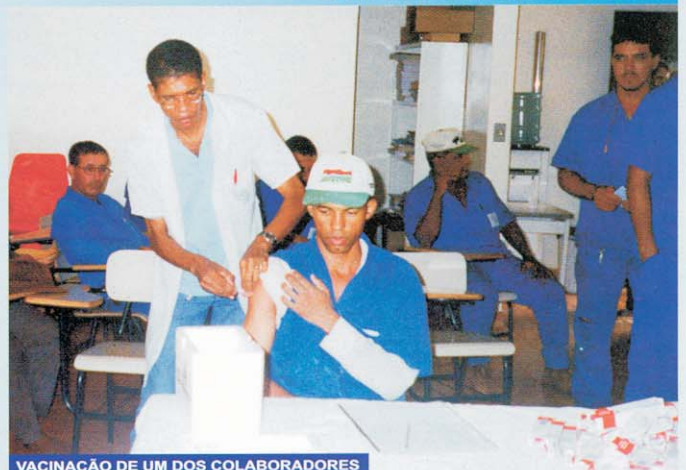
VACINAÇÃO DE UM DOS COLABORADORES

Apesar de comumente apresentar a imagem de uma doença benigna, a gripe é uma moléstia séria, altamente contagiosa que provoca febre elevada, dores musculares, fraqueza, dor de cabeça, tosse intensa, coriza e dor de garganta. A vacina diminui muito os riscos de contrair a doença. Em indivíduos saudáveis a eficácia clínica varia de 70% à 90% de proteção, valor este muito significativo. Mesmo vacinadas, algumas pessoas podem contrair a gripe, porém na maioria das vezes os sintomas são mais fracos, parecidos com o de um resfriado. Em matéria veiculada no jornal Estadão, uma pesquisa realizada nos EUA, afirma que idosos que se vacinam contra gripe ganham proteção também para o coração. Os benefícios são indiretos, já que, a partir dos 65 anos, pegar gripe significa deixar o corpo mais vulnerável a complicações cardiovasculares, como enfarte e derrame. A boa notícia acaba