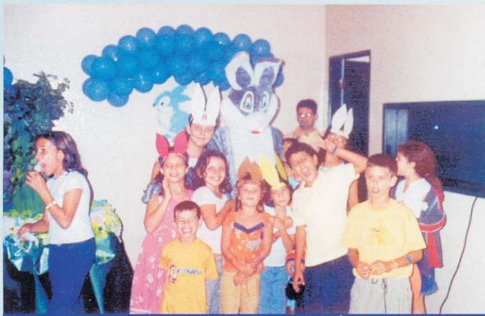
Crianças se alegram com coelho da páscoa

Em comemoração à Páscoa, foi realizado no mês de Abril, uma festa de confraternização e também foram entregues 1500 ovos de páscoa a todos os nossos colaboradores. Páscoa é dizer sim ao amor e a vida, é investir na fraternidade, é lutar por um mundo melhor, é vivenciar a solidariedade e com este sentimento, desejamos que o espírito de união vivenciado no período de páscoa, possa acompanhar todos os nossos colaboradores e seus familiares no decorrer deste ano.