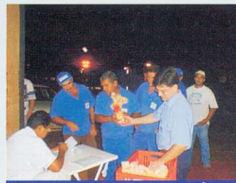
Colaboradores - Fz. Rosário

Em comemoração à Páscoa, foi realizado no mês de Abril, uma festa de confraternização e também foram entregues 1500 ovos de páscoa a todos os nossos colaboradores. Páscoa é dizer sim ao amor e a vida, é investir na fraternidade, é lutar por um mundo melhor, é vivenciar a solidariedade e com este sentimento, desejamos que o espírito de união vivenciado no período de páscoa, possa acompanhar todos os nossos colaboradores e seus familiares no decorrer deste ano.